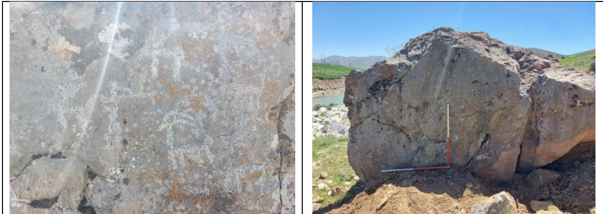
تصویر ۱۱: نمایی از نگاره‌های روستای مراد آباد گل گل دلفان (نگارندگان، ۱۴۰۲)

جدول ۱۱: مشخصات و ویژگی‌های کلی سنگ‌نگاره‌های مراد آباد گل گل (نگارندگان، ۱۴۰۲)