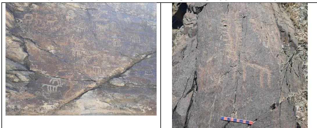
جدول ۳: مشخصات و ویژگی‌های کلی سنگ‌نگاره‌های سنگ سفید (نگارندگان، ۱۴۰۱)