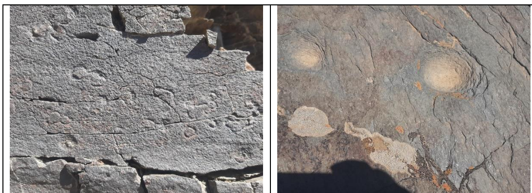
تصویر ۳: نمایی از نگاره های حیوانی، فنجان نماها و حفره ها و شیارهای سنگ سفید الیگودرز (نگارندگان، ۱۴۰۱)