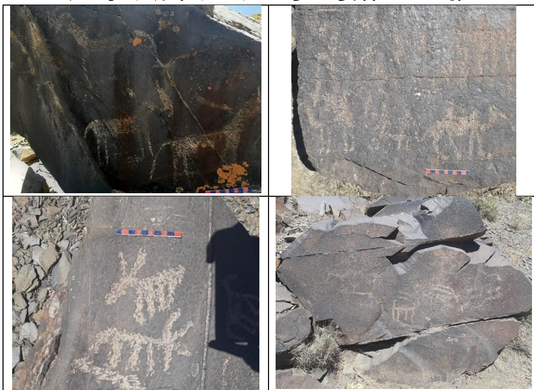
تصویر ۲: نقوش بزسان، شتر و اسب سان مجموعه دره موسیر(نگارندگان، ۱۴۰۳)