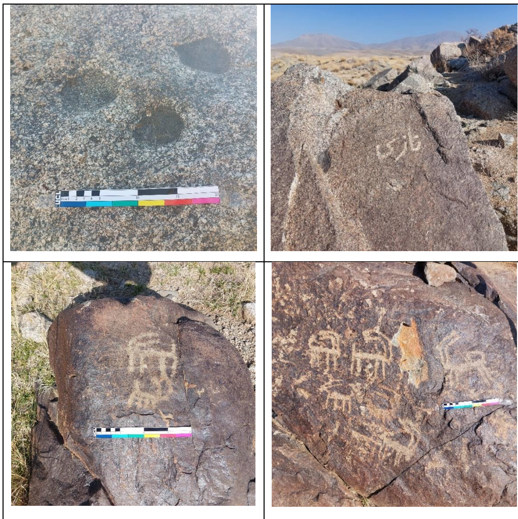
تصویر ۱: نقوش حیوانی، فنجان نما و سنگ نبشته های مجموعه کزنار (نگارندگان، ۱۴۰۳)