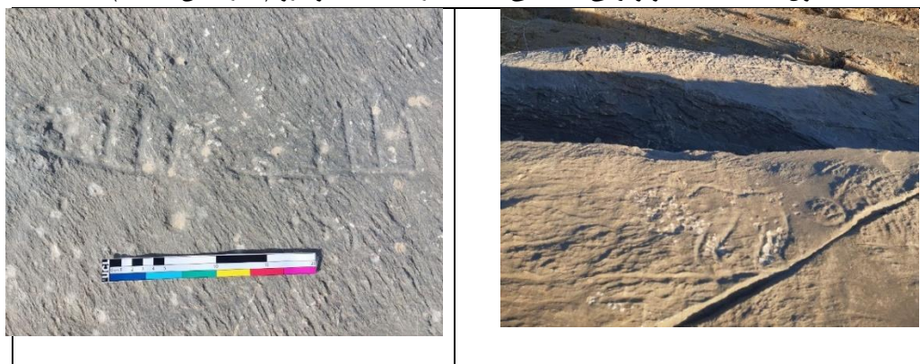
تصویر ۸: نمایی از نگاره های محوطه که کو دورود(نگارندگان، ۱۴۰۳)