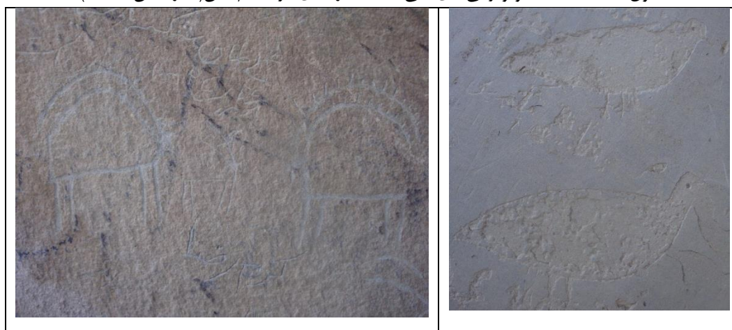
تصویر ۱۰: نمایی از نگاره های حیوانی، پرنده گان و سنگ نبشته های مر کاظم خان دلفان (نگارندگان، ۱۳۹۴)