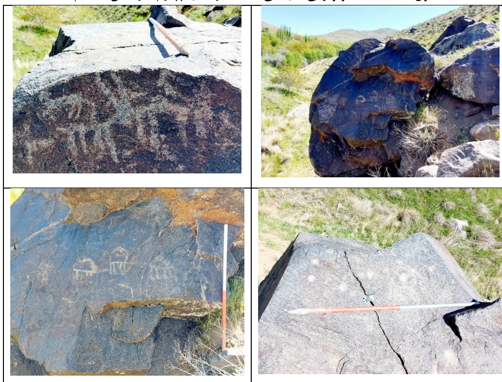
تصویر ۵: نمایی کلی از نگاره های حیوانی چپدر بروجرد (نگارندگان، ۱۴۰۳)

جدول ۵: مشخصات و ویژگی های کلی سنگ نگاره های چپدر (نگارندگان، ۱۴۰۱)