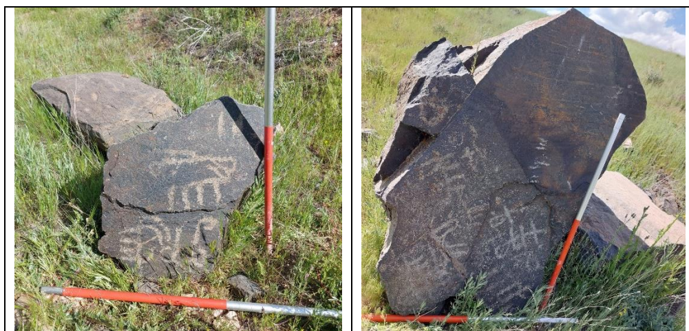
تصویر ۷: نمایی از نگاره های فخر آباد بروجرد(نگارندگان، ۱۴۰۳)