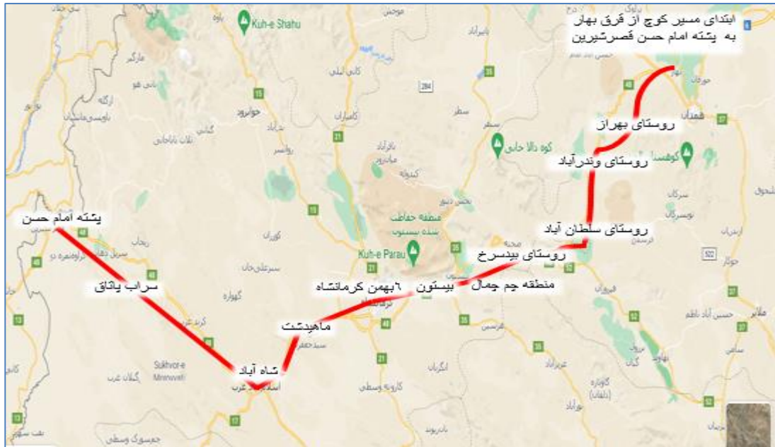
منبع: قلی‌پور و همکاران، ۱۴۰۲

نقشه شماره ۳: مسیر کوچ ایل ترکاشوند از قرق بهار تا پشته امام حسن قصرشیرین پیش از سال ۱۳۳۲